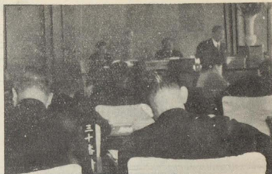
市会開催中の議場