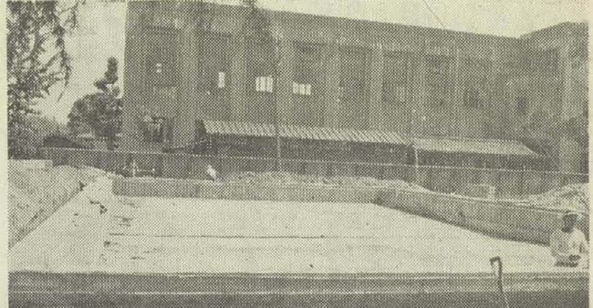
完成いそぐプール 4地区に建設工事中

これから季節に入ると水辺で遊ぶ子供が多くなり、毎年のことながら水におぼれて幼い生命を失うことがあります。すでに、一月から七月五日までに、府下では五十二人の子供が水の犠牲になっています。 警察署では、このような事故を少しでも防ぐよう保護者の方にも事実を記入していただきます。