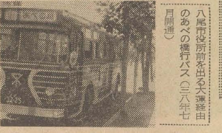
八尾市後所前を出る大連線由のあべの橋行バス(三十八年七月開通)

一、市では一昨年交通安全都市を宣言し、市民生活をおびやかす交通事故防止対策を検討してきたが、この運動の強力な推進のため、委員が街頭でP・Rと啓蒙運動を要望している。