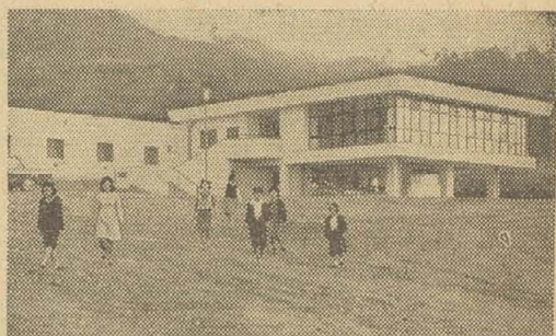
大阪市立青少年憩の家で楽しいひとときをすごす両市の市民たち