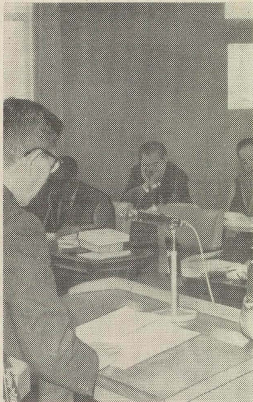
三月市議会本会議で市政方針を発表する大橋市長