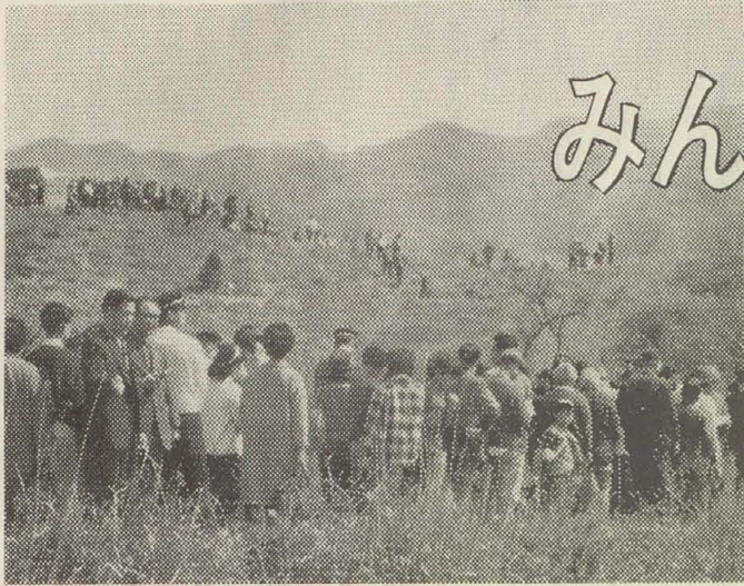
心合寺山古墳での参加者