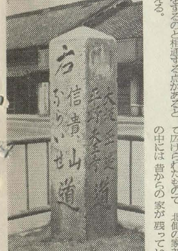
この道標は、噴水公園整備の際、西南の角から西北の角へ移された