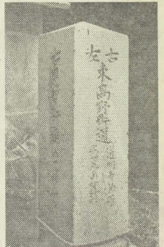
高野街道にある道標

近鉄高野駅から東へ向って東高野街道との交差点に二つの道標が建てられている。その一つは大阪府が建てたもので、もう一つは地元の人達が建てたものである。 大阪府の建てたものは、東高野街道と恩智街道の表示を大きく彫り、下には行先案内が記してあり、恩智街道の下には「八尾停車場」とある。 恩智街道はここから階川、八尾