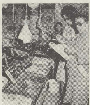
▲市衛生婦人奉仕員が一日食品衛生監視(7月9日)