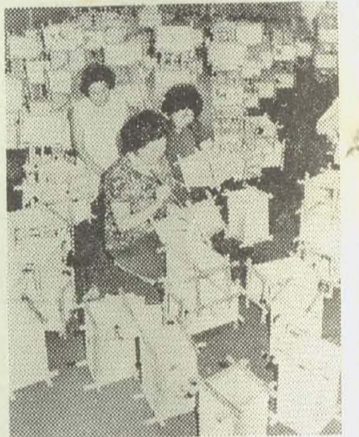
▲ 檀家の人によって作られる絵燈ろう

絵燈ろうは、タテ、ヨコ各15cm、高さ30cmでまわりに和紙を貼り、太子像、野仏、ハスなどが描かれている。