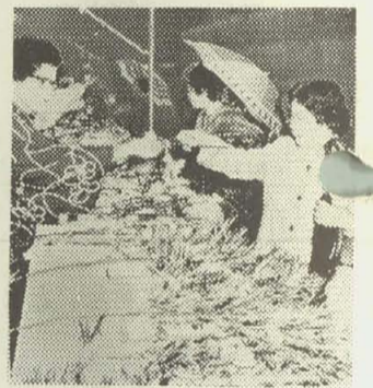
▲福ザサのかけ声も威勢よくにぎわう八日戎

境内には、50-60の露店がたち並び、参詣の善男善女に「商売繁盛福ザサ、福ザサ」とカネやタイコとともに威勢よいかげ声がかけられ、1年の家内安全、商売繁盛を願う人たちの間に、調子のよいやりとりがなされる。